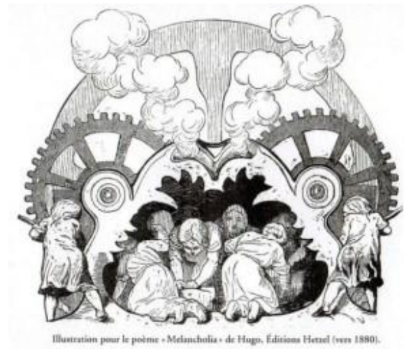
Illustration pour le poème « Melancholia » de Hugo, Éditions Hetzel (vers 1880).

Voici l'illustration proposée par les Éditions Hetzel au poème Mélancholia de Victor Hugo. Après avoir fait une recherche sur le thème du poème et son contexte historique, retrouvez le(s) vers du poème qui justifierai(en)t cette proposition.